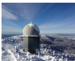
Radar Systems Support