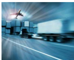
Logistik und Technische Dokumentation